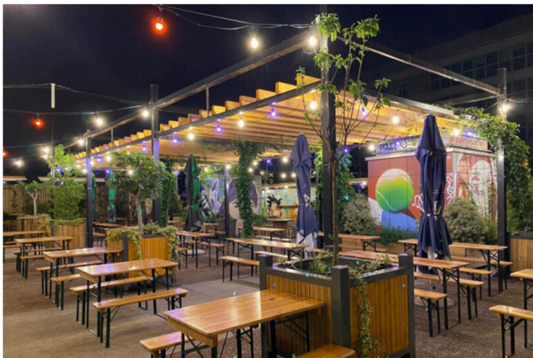
LE PATIO ROOFTOP

A cheval entre Montreuil et Paris, en longeant le périph, Le Patio Rooftop se cache derrière un magasin Decathlon et après des escaliers colorés qui mènent à une grande enclave au milieu d'immeubles. Ici, pas d'histoire de hauteur ni de vue, mais une ambiance décontractée pour manger et boire un verre. Tables d'hôte en bois, pots de plante gigantesques et bonne playlist sont les ingrédients idéals pour décompresser. Les jeudis et vendredis soir, en mode afterwork. Le samedi soir, lors de la soirée reggae dancehall jusqu'à 2 heures du matin (entrée à 10 euros). Les couche-tôt apprécieront l'ambiance familiale le week-end, surtout au brunch du dimanche. Une formule déjeuner est proposée du lundi au vendredi : 12,90 euros pour entrée-plat. Pizzas, nems, sushis et chirashis à la carte.